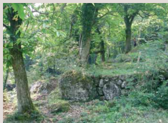
Dieser alte, eingewachsene Kastanienhain soll restauriert und gepflegt werden. Chesteneweid, Weggis LU