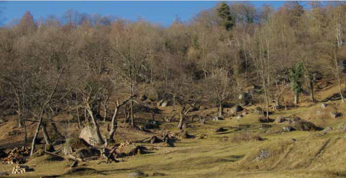
Hainrelikt Chesteneweid, Weggis LU

Die Interessengemeinschaft Pro Kastanie Zentralschweiz, die Kantone und der Fonds Landschaft Schweiz setzen sich seit Jahren ein für den Erhalt letzter Hainrelikte. Nun soll die alte Kastanienkultur zu neuem Leben erweckt werden.