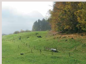
Hier soll auf Landwirtschaftsland ein neuer Kastanienhain entstehen. Giglen Allmend, Stalden OW